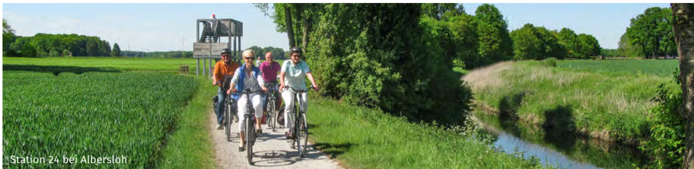
Station 24 bei Albersloh

Der WerserRadweg verläuft auf 123 Kilometern steigungsarm mal direkt entlang der Werser, mal weiter abseits durch die von der Werser geprägte Landschaft. Er verbindet die Städte Ahlen, Beckum, Drensteinfurt, Hamm, Münster, Oelde, Rheda-Wiedenbrück und Sendenhorst mit ihren historischen und sehenswerten Ortskernen.