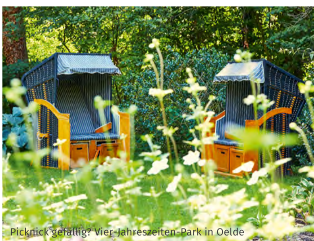
Picknick-gemütlich? Vier-Jahreszeiten-Park in Oelde

Dem Lauf der Werser folgend, werden in kleinräumigem Wechsel unterschiedliche Kultur- und Landschaftsräume berührt. Besonders eindrucksvoll präsentiert sich der Kontrast zwischen dem industriell geprägten Oberlauf, dem anschließenden ländlichen Charakter mit einem Mosaik von Bauernhöfen, Feldern und Wäldern sowie