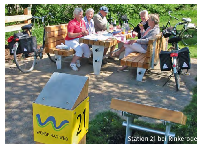
Station 21 bei Rinkerode

Stelen schaffen Aufmerksamkeit und Orientierung, und wer seine Pause gerne unter dem hohen Himmel des Münsterlandes macht und sein Lunchpaket im Freien verzehren möchte, der findet in regelmäßigen Abständen Rastplätze mit Tischen und Bänken sowie Schutzhütten.