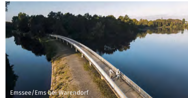
Emssee/Ems bei Warendorf