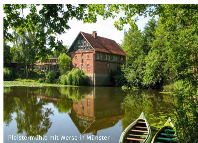
Pleistemühle mit Werser in Münster