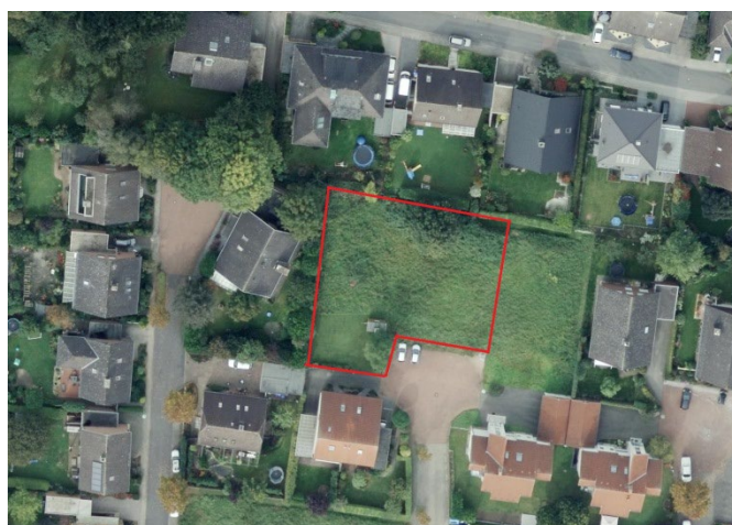
Auszug aus dem Luftbild - (Datenlizenz Deutschland Land NRW / Kreis Warendorf (2018) Version 2.0)