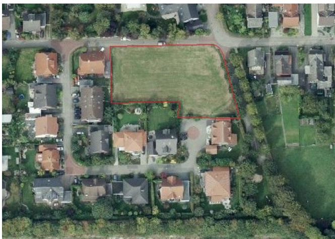
Auszug aus dem Luftbild - (Datenlizenz Deutschland Land NRW / Kreis Warendorf (2018) Version 2.0)