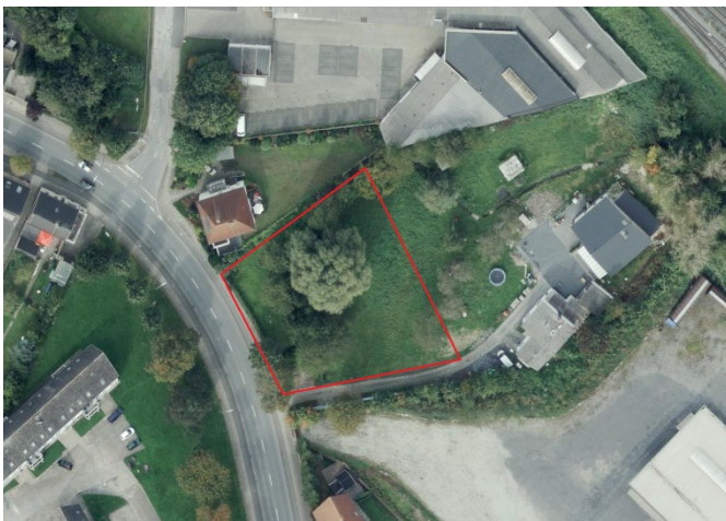
Auszug aus dem Luftbild

Bebaubarkeit richtet sich nach §34 BauGB "unbeplanter Innenbereich"