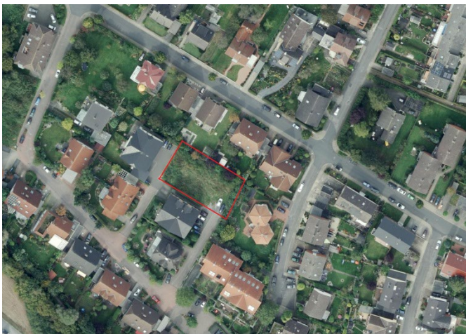
Auszug aus dem Luftbild (Datenlizenz Deutschland Land NRW / Kreis Warendorf (2018) Version 2.0)