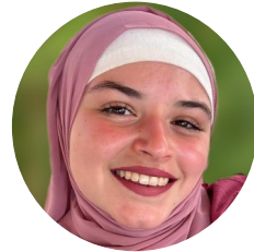
Vildan Catakli Moscheeverein Neubeckum