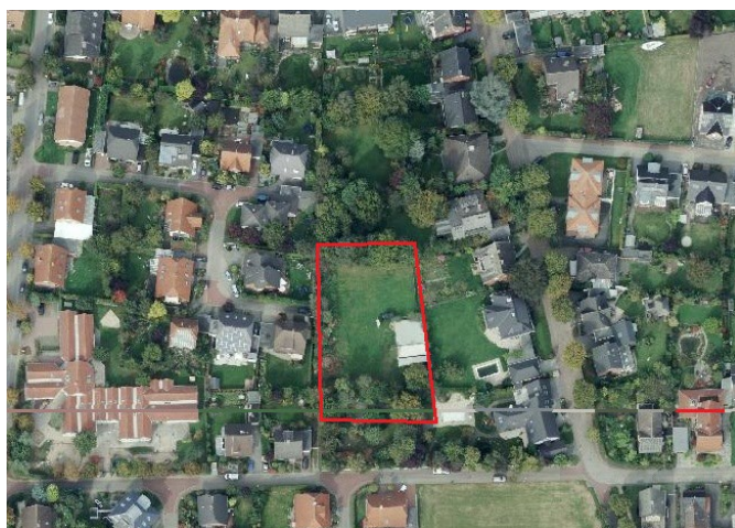
Auszug aus dem Luftbild - (Datenlizenz Deutschland Land NRW / Kreis Warendorf (2018) Version 2.0)