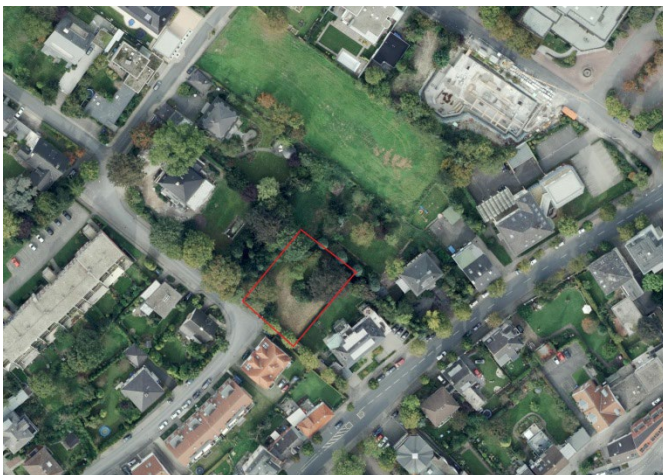
Auszug aus dem Luftbild - (Datenlizenz Deutschland Land NRW / Kreis Warendorf (2018) Version 2.0)