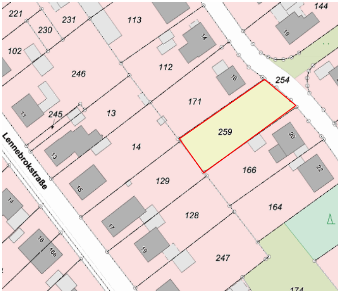
Auszug aus der Katasterkarte - (Datenlizenz Deutschland Land NRW / Kreis Warendorf (2018) Version 2.0)