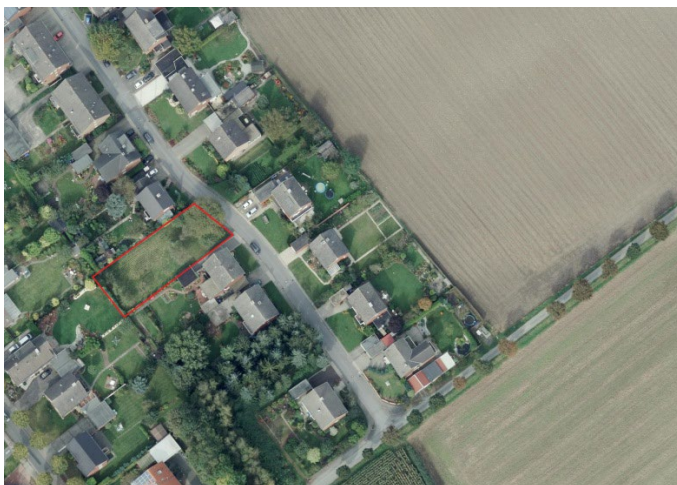
Auszug aus dem Luftbild